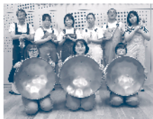
安来スティールパン オーケストラ (スティールパン演奏& ミニ楽器体験コーナー)

楽器の演奏や朗読劇を行います。 実際に触れる楽器体験コーナーや、一緒に歌うコーナーもあります。