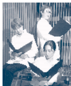
演劇 Project Bee (朗読劇)